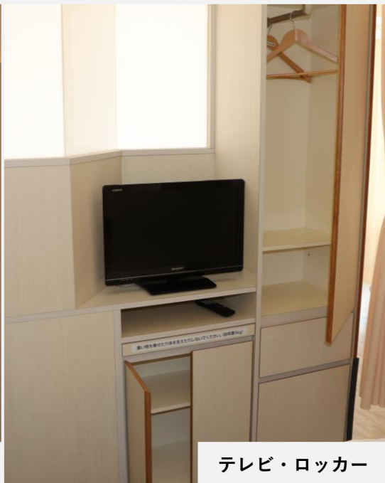
テレビ・ロッカー