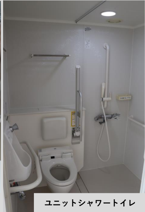
ユニットシャワートイレ